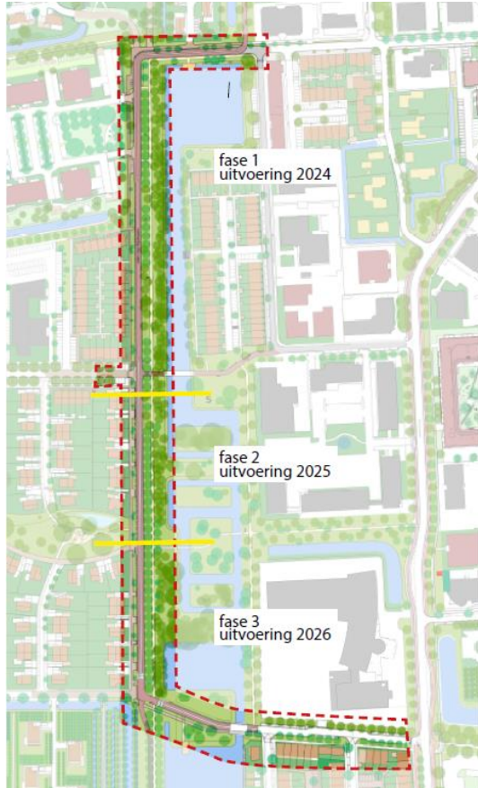
Kaart 1: Overzicht van de planning van de aanleg van de Laan van Rijnhuizen per fase.