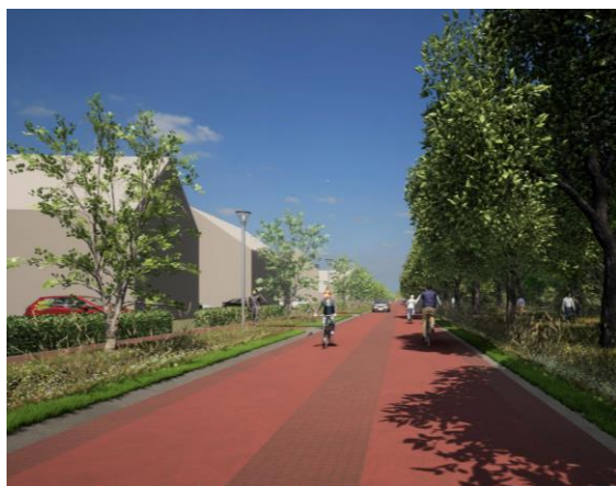
Impressie Laan van Rijnhuizen